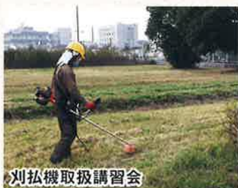
刈払機取扱講習会