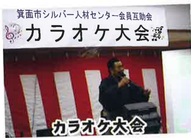
箕面市シルバー人材センター会員互助会 カラオケ大会