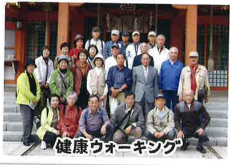
健康ウォーキング