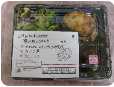
あっとほーお弁当 ¥500(1食)