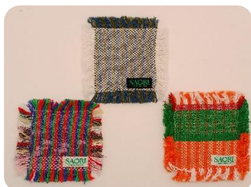
さをり織りコースター ¥150(1枚)