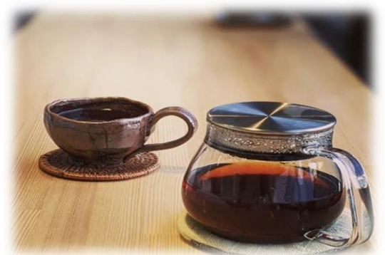
ALL ドリンクメニュー 陶芸&紅茶カフェ Pottery ぽたりい 箕面 6-4-43 ジョイビル 3F