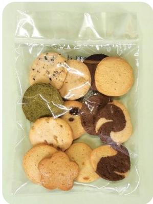
赤い羽根ミックス クッキー ¥230(約75g)