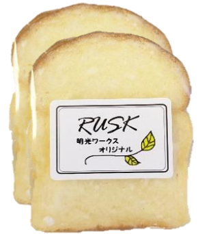
赤い羽根ラスク ¥120(2枚組)

売り上げの一部が 赤い羽根共同募金 に寄付され地域福 祉活動の支援に活 用されます