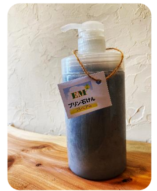
EM プリン石けん プレミアム炭入り ¥550(600ml)