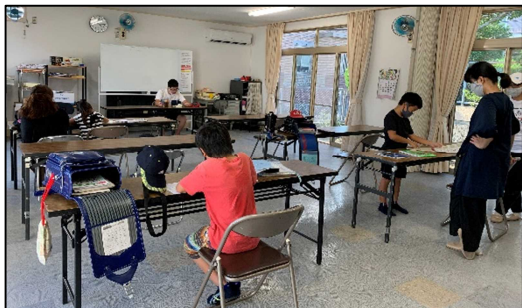
【豊川北小校区】間谷住宅自治会館にて(9月の初日は6名の子どもと4名のボランティアが参加)

冬は日が短く、子どもたちが放課後も学校にいと帰る頃は真っ暗になります。「家の近くにある自治会館で放課後を過ごすことができると安心できるのでは」と、間谷住宅の有志で話し合い、自治会館で宿題をしたり、遊んだり、楽しい時間を過ごすことができる居場所の準備を進めてきました。