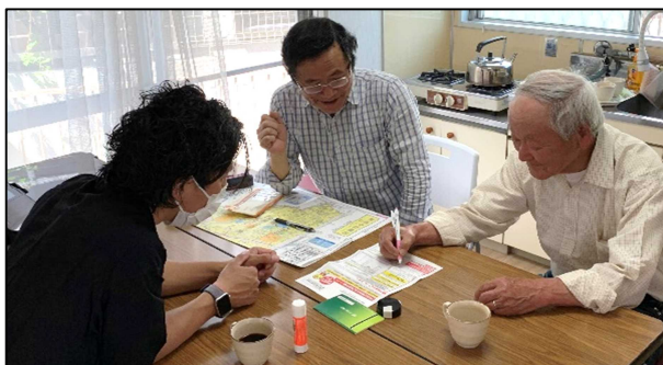
【萱野小校区】ハイムタウン箕面自治会(5月)

緊急経済対策として1人10万円が支給された特別定額給付金。市役所から案内が届いても、通帳のコピーや申請書の記入などを難しく感じる人が多くいました。そこで、自治会の集会所に簡易コピー機を用意して申請書手続きのお手伝いをしました。