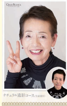
ナチュラ化粧品コース (生涯学習)

実施時間 (全5回) ①10:00~11:00 ②11:00~12:00 ③13:00~14:00 ④14:00~15:00 ⑤15:00~16:00 申込み受付開始 12月23日 (金) 午前9時から