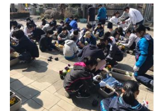
プランターへの植え替え

皆さん、ありがとうございました。今後とも変わらぬご支援のほどよろしくお願いいたします。