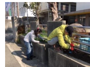
雑草を抜いて花壇の整備

卒業式に向けて、「二中花の会」の皆さんが、花壇の整備、花の植え替えをしてくださいました。また、在校生も花道をつくるために、プランターへの花の植え替えをしてくれました。地域・在校生・保護者の皆さんに温かく見守られながら、3年生は二中を巣立とうとしています。