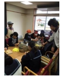
北芝集会所にてクロックづくり