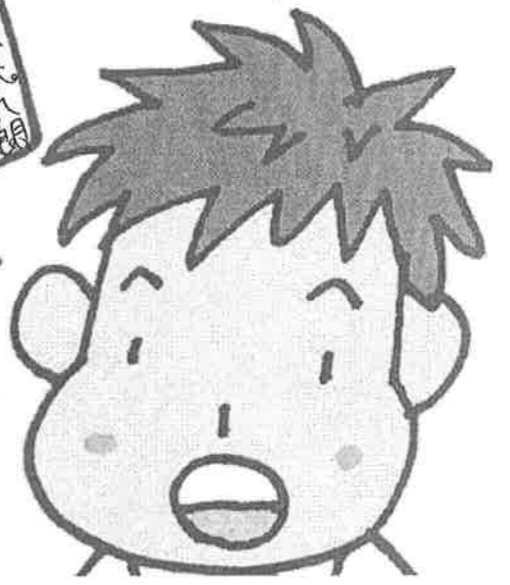
3年生 英語を 担当して頂きました。