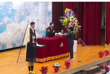
卒業証書授与 校長より一人ひとりに手渡されました