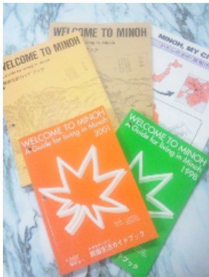
みの おせいかつ 箕面生活ガイドブック