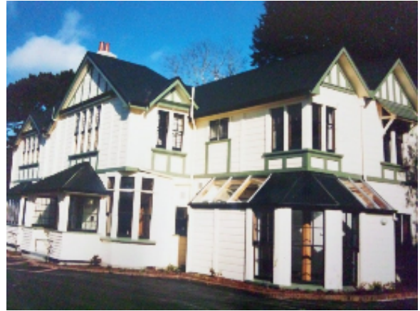
ハット・箕面友好ハウス