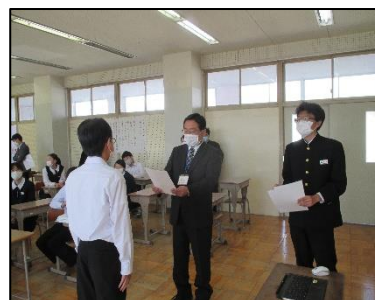
表彰された1年1組の美化委員さん