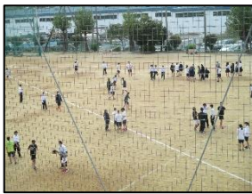
昼休みにリレーの練習