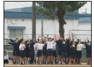
3年のダンスを応援する2年生

今年度は、コロナ禍の影響で全校生徒が集まる機会がなかったのですが、「3学年一斉体育」ではどの学年も他学年の競技を応援し、大いに盛り上がりました。全校生徒が一同に集まり、一つのことをすることが、いかにかけがえのないものであるかを改めて感じた時間となりました。