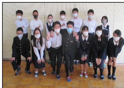
前後期の生徒会役員のみなさん