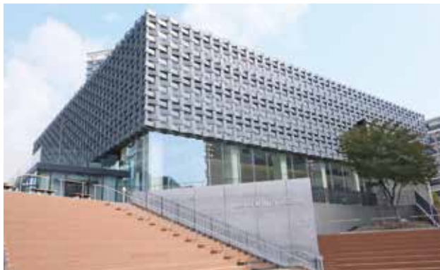
※令和7年5月から箕面市立文化芸能劇場の愛称が「東京建物 Brillia HALL 箕面」となりました。