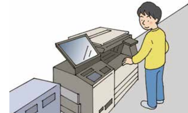
※マイナバーカードがあれば、住民票の写しなどの証明書を全国のコンビニなどに設置してあるマルチコピー機で取得できます。