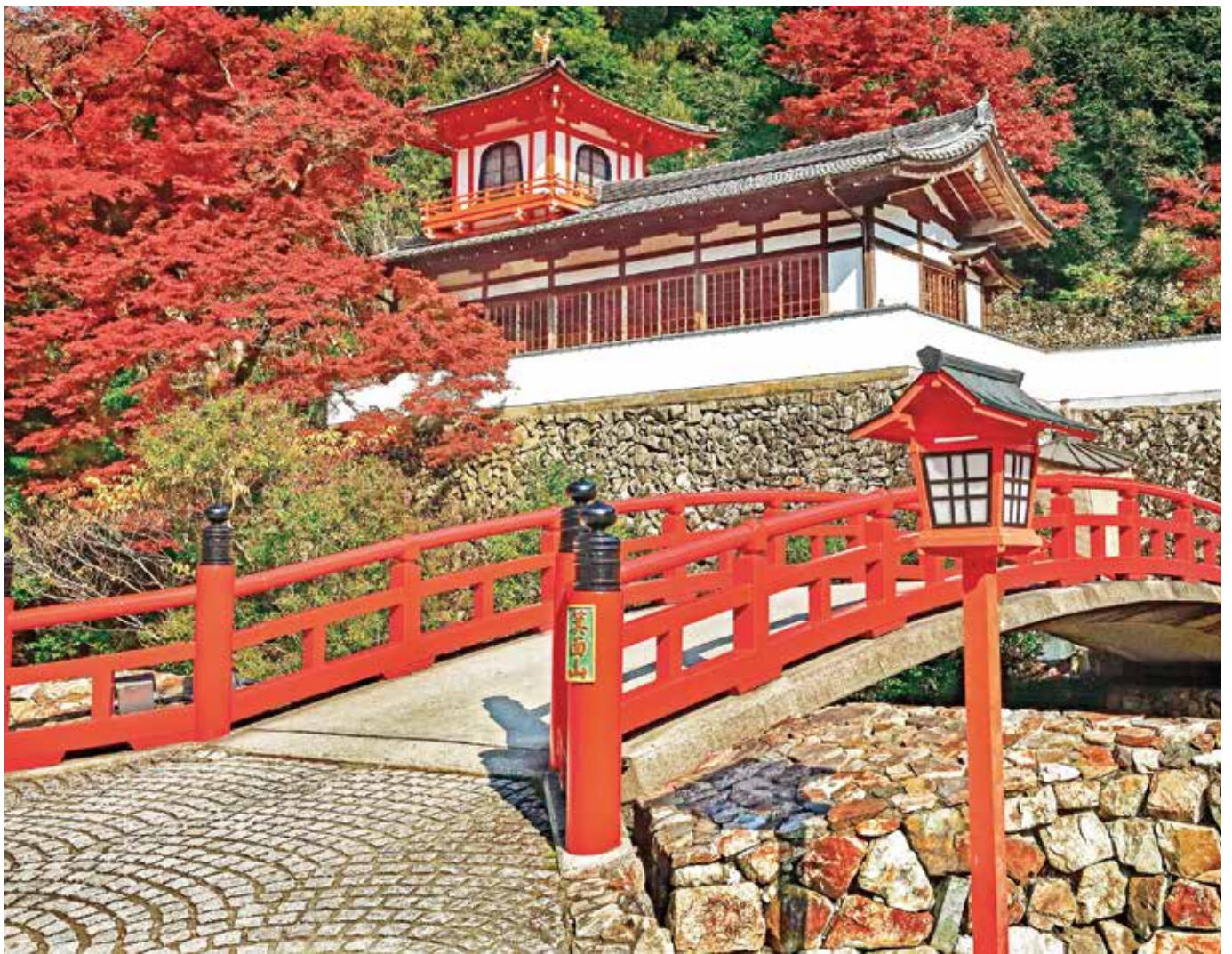
晩秋〈箕面山瀧安寺〉