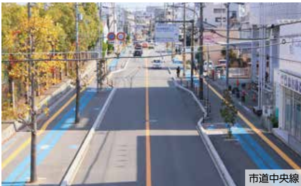
※歩行者と自転車、双方の安全を確保するため、自転車の通行区分を標示した自転車通行空間の整備を進めています。