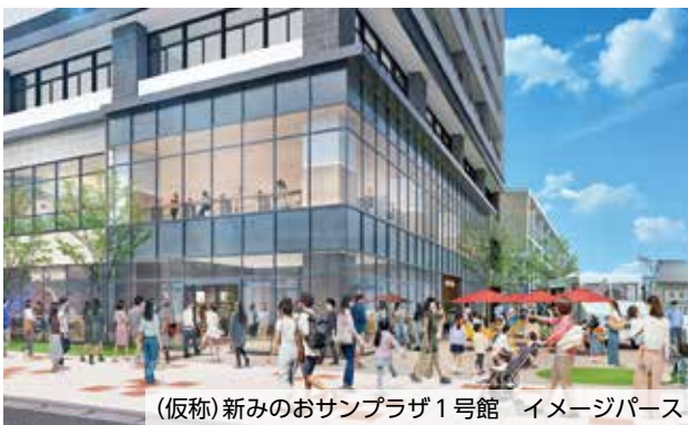
※令和9年度末竣工予定。パースは計画段階(令和7年6月時点)の図面を基に描き起こしたもので、実際とは異なります。