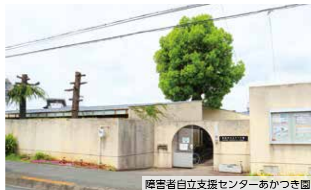
※18歳以上の障害のあるかたを対象に、本人主体の地域生活をトータルに支援する施設です。