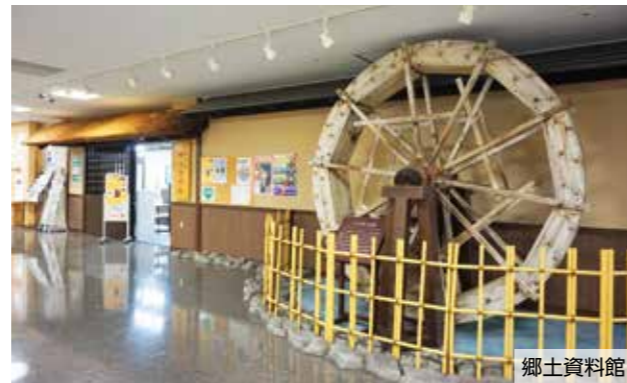
※みのおサンプラザ1号館の建て替えに伴い、旧教育センター跡施設に移転します。