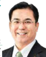
公明党 岡沢 聡