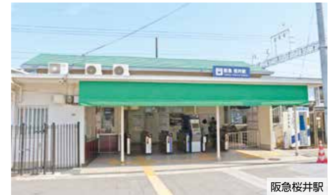
※現在、北改札口のみ阪急桜井駅。南改札口の整備に向け動き出します。