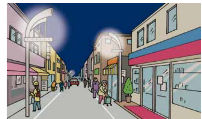
※令和5年度中に、既設街路灯をLED化した商店会に対し、改修経費の90%(上限18万円/基)を補助します。