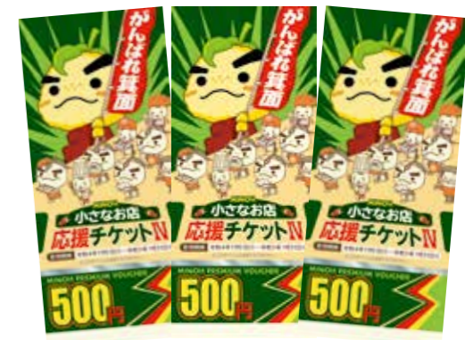
小さなお店応援チケット

※物価高騰で負担が増えた家計への支援のため、これまでの支援策が届いていない低所得者層に、1世帯あたり5,000円分を配付します。