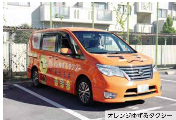
オレンジゆずるタクシー

※年中無休(午前7時～午後6時)で、健康上の理由などで、電車やバス、一般タクシーを利用しづらいかたが利用できます。