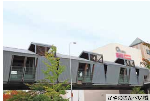
かやのさんぺい橋

※約20年が経過し、上屋の劣化が判明したため、補修工事の設計を委託します。工事は令和5年4月から実施予定です。