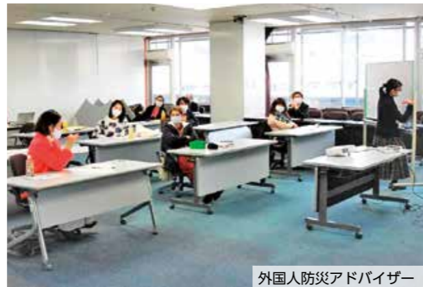
外国人防災アドバイザー

※毎年5人程度の外国人防災アドバイザーを養成し、外国人市民が安心して暮らせるまちづくりを進めています。