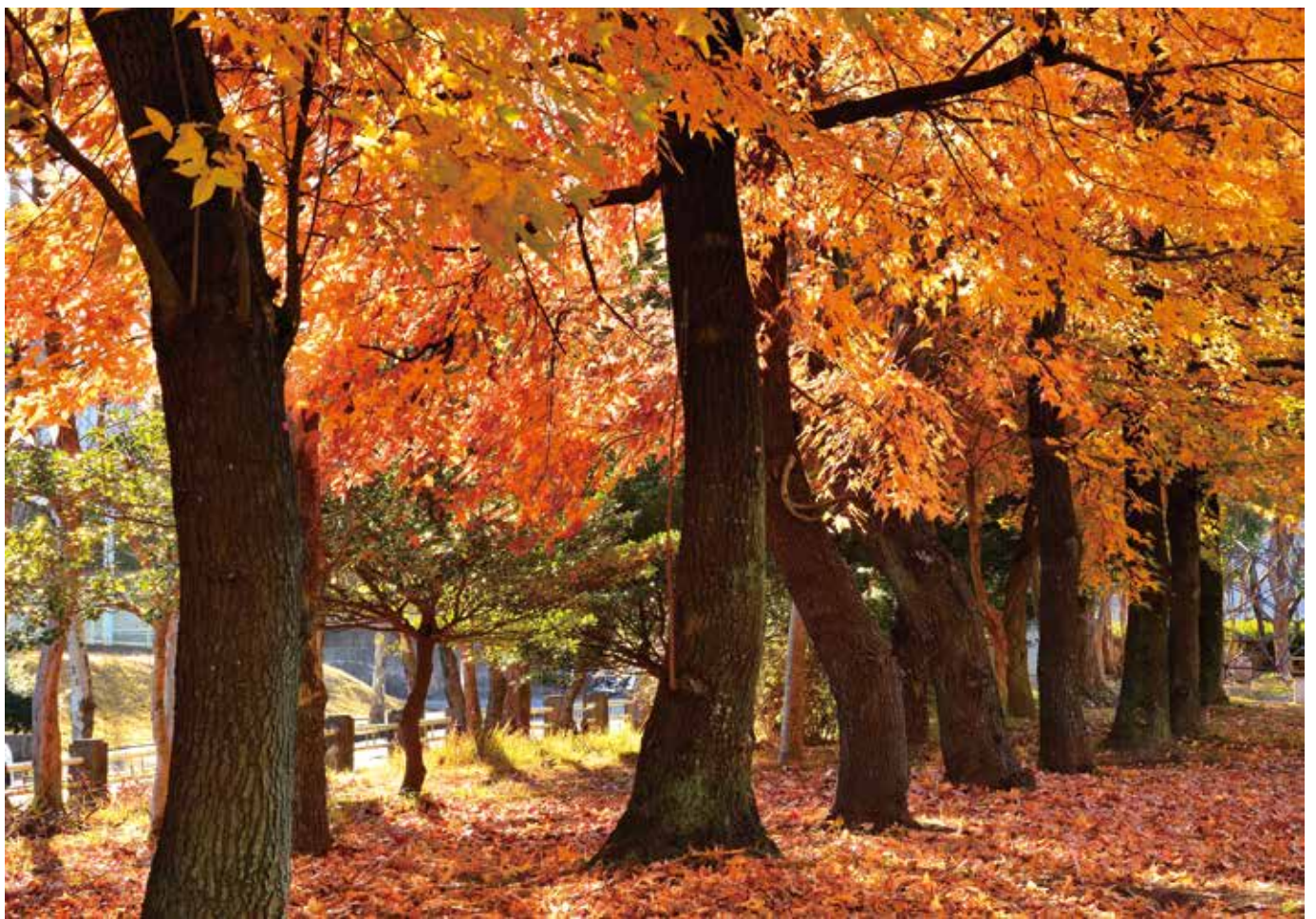
晩秋〈新船場南公園〉