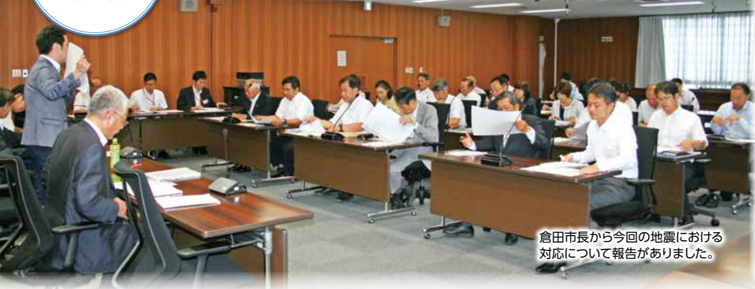
倉田市長から今回の地震における対応について報告がありました。