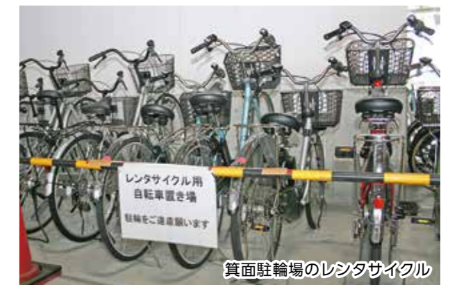
※観光振興を目的に10台(うち電動アシスト2台)確保しています。また、箕面市観光協会からも電動アシスト7台を配備しています。