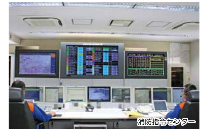
※本市と豊能町内からの119番通報を受信し、消防車や救急車の出動指令を行うためのシステムで、平成31年4月から新回線に変更する。