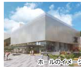
ホールのイメージ

平成32年度開業をめざし、延伸工事を進めており、完成すれば、新大阪・梅田・なんばなどの大阪都心に乗り換えなしでアクセスが可能となります。また、新駅には大阪大学箕面キャンパスの移転が決定していることや市民ホールの移転なども計画されており、みどり豊かな箕面のまちの魅力が更にアップします。