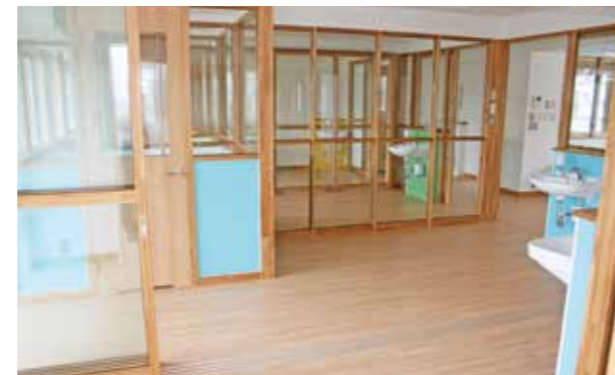
※平成30年9月に開設予定の市立萱野保育所内の病児・病後児保育室