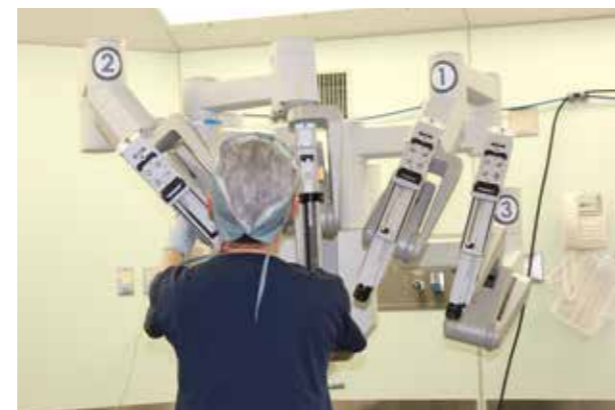
※平成27年5月に北大阪の自治体病院で初めて導入しました。患者さんの身体への負担が少なく、精度の高いがん手術が可能となります。