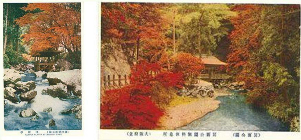
当時の箕面川床の絵はがき(箕面市行政史料)

当時は日本最大級の箕面動物園や箕面大滝への行楽客が川床を楽しんでいました。その後、度重なる洪水などが原因で次第に箕面川床は衰退していきました。