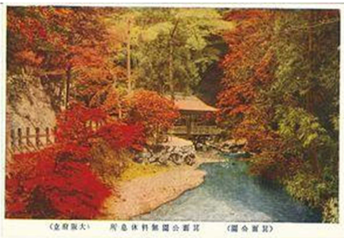
当時の箕面川床の絵はがき（箕面市行政史料）