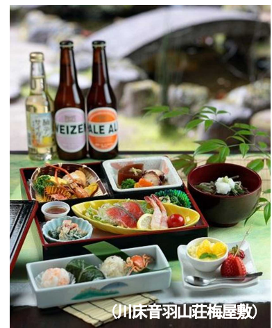
(川床音羽山荘梅屋敷)