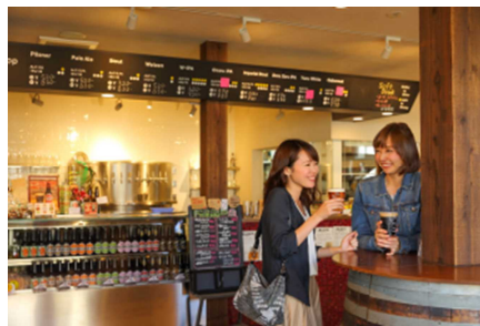
【Aプラン：箕面ビール試飲】