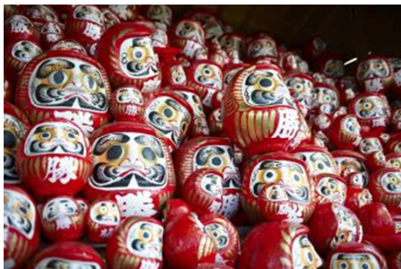
【Cプラン：勝ちダルマ絵付け体験】