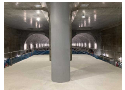
【Bプラン：北急延伸現地見学】