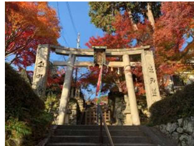
【Dプラン：良縁の寺、西江寺】