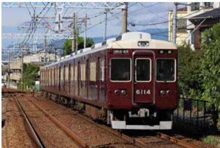
【全国でもファンが多い阪急電車を貸切に】