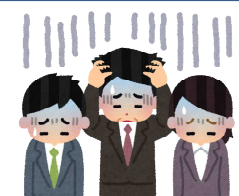
負担が大きい教員