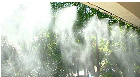
運動場ミストシャワー(イメージ写真)