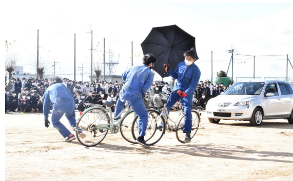
自転車同士の正面衝突事故の実演