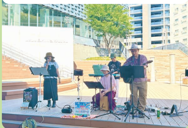
音楽ユニット「まーぶる」