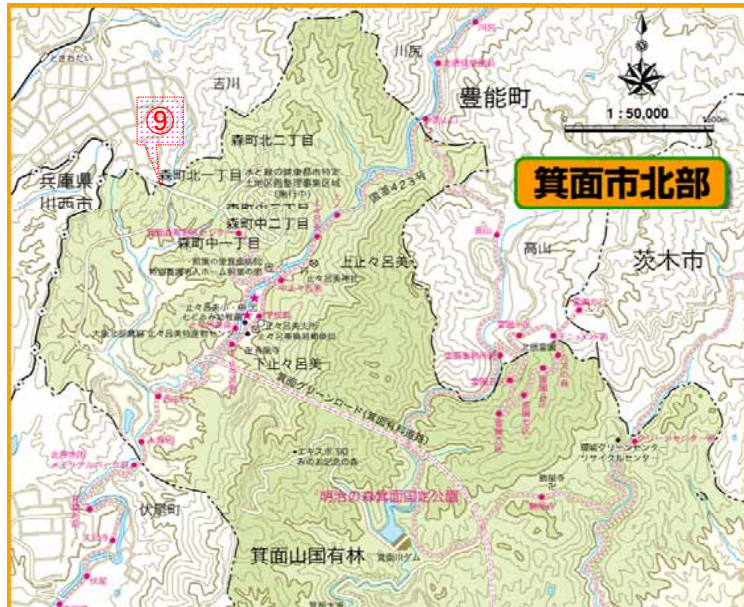
災害時相互連絡配水管の既協定内容及び今後締結予定