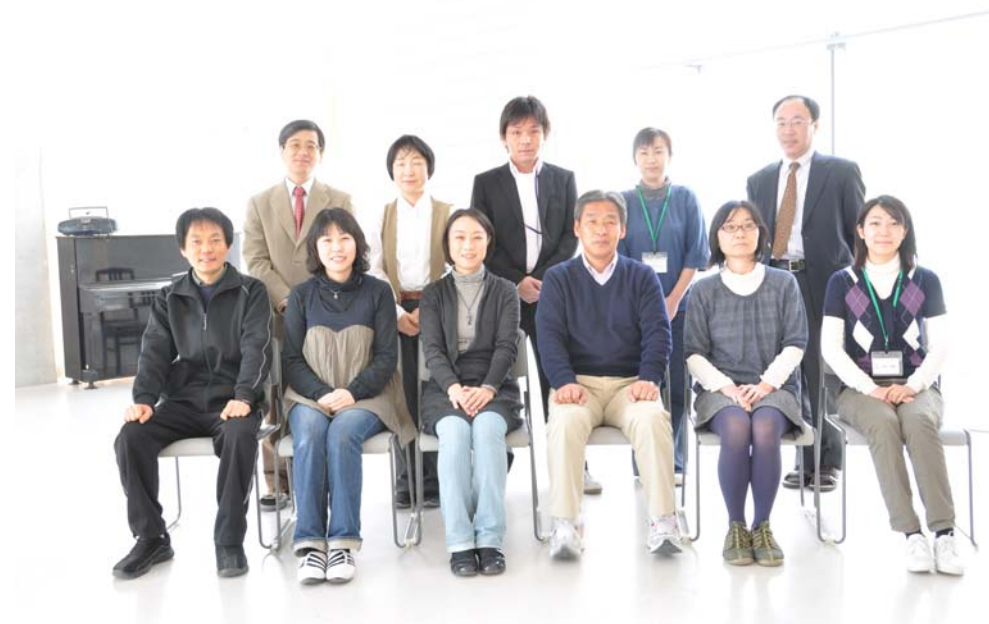
中期：教職員集合写真