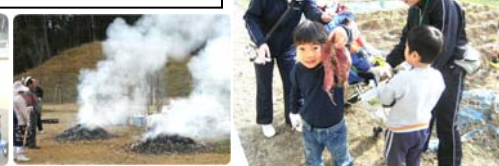
給食も焼きいももペロリ