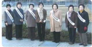
更生保護女性会の方たち