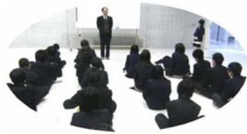
熱心にお話を聴く中学生