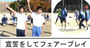
宣誓をしてフェアプレイ