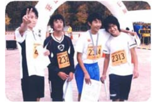
入賞した4人の さわやかな笑顔