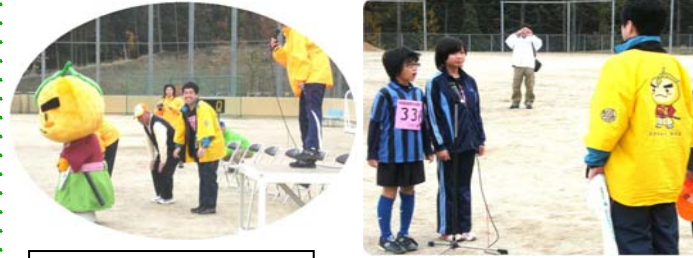
市長さんもたきのみち ゆるくんも準備体操