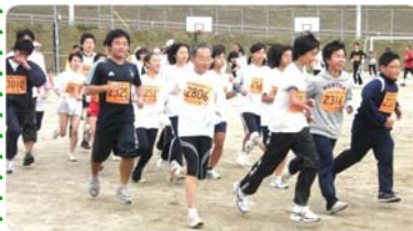
スタート直後、まだ笑顔が見えます。