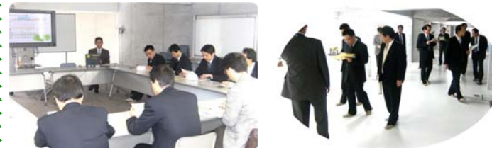
熱心にメモを取りながら説明を聞かれました。

1月27日(水)には文部科学省指定研究開発の中間報告会を午後1時45分から開催します。是非、皆様方も参観等ご参加いただきたいと思います。建物だけではなく教育の内容も、全国に発信していきたいと思ひます。