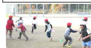
おかわりしっぽとり

ゲームをしたり、鬼ごっこ「おかわりしっぽとり」をして遊びました。小学生がうまく教えていました。