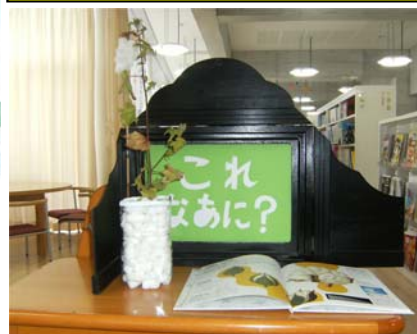
答えは図書館まで。