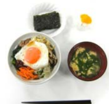
ビビンパ定食完成