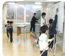
みんなでおそうじ

小学生が中学生の教室を掃除したり、アリーナも小中合同で掃除をしています。まさしくみんなで学校をきれいにしています。