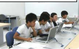
ニュースを作る8年生