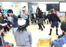
楽しくとどろみバスケット