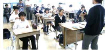
不動さんの体験を聴きました。