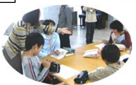
特認希望者と6年生・園児の交流