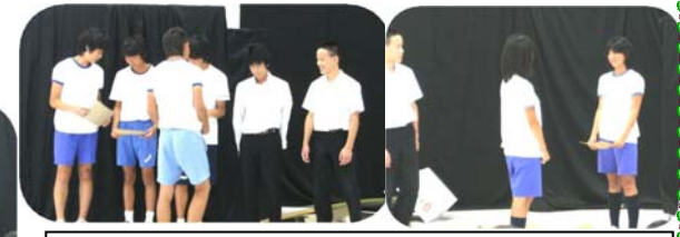
最後にちょっとしんみり