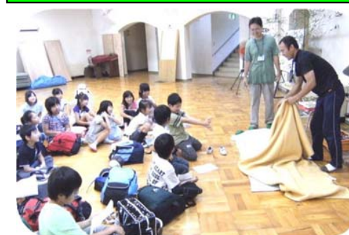
自分の寝るところは自分で