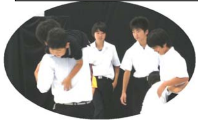
絵をうまく動かした2年生