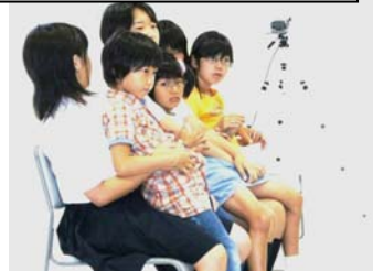
3年生の人形がかわいい