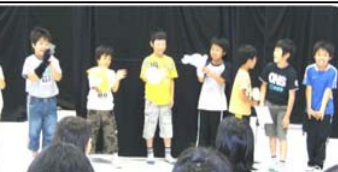
決めのポーズ5年生