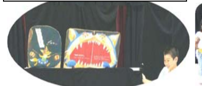
お行儀よく鑑賞できました。