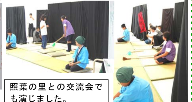
照葉の里との交流会でも演じました。