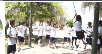
みんな楽しく遊んでいます。