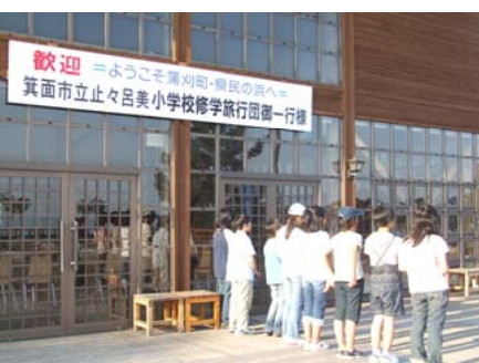
原爆ドーム前で記念写真撮影