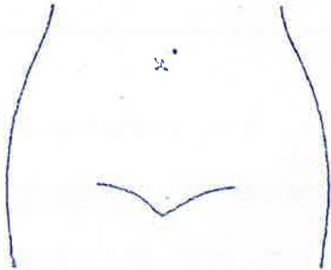
(ストマ及びびらんの部位等を図示)