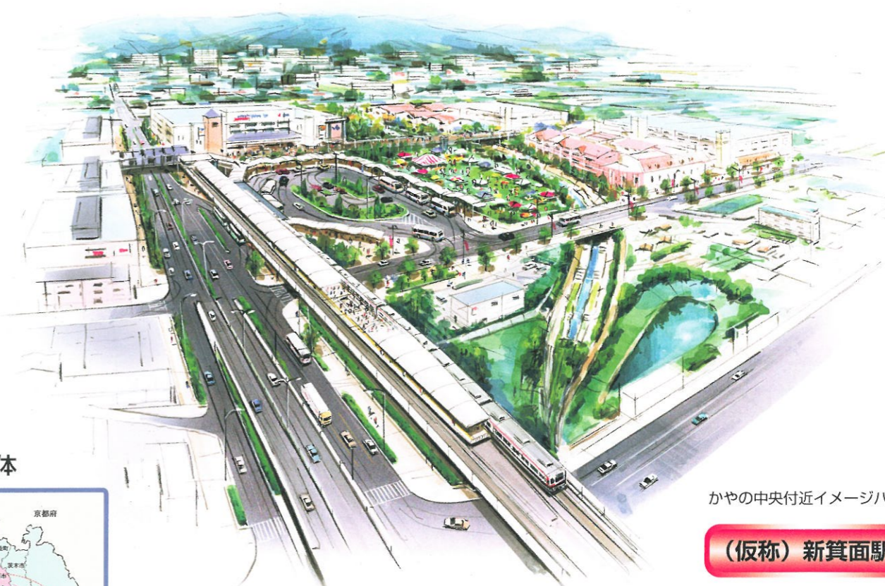
かやの中央付近イメージパース