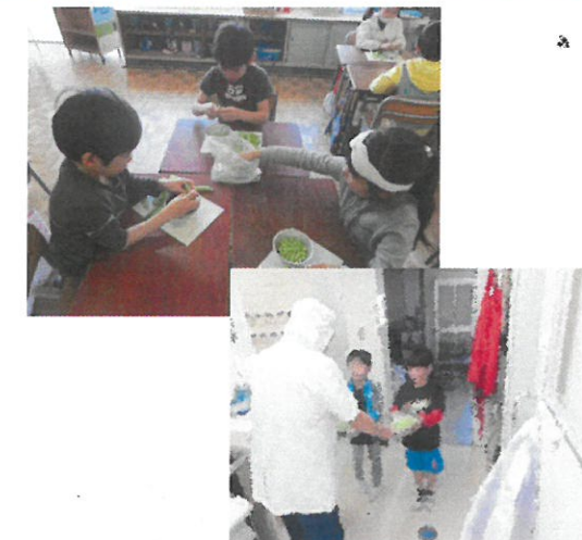
2年生給食のえんどう豆むき