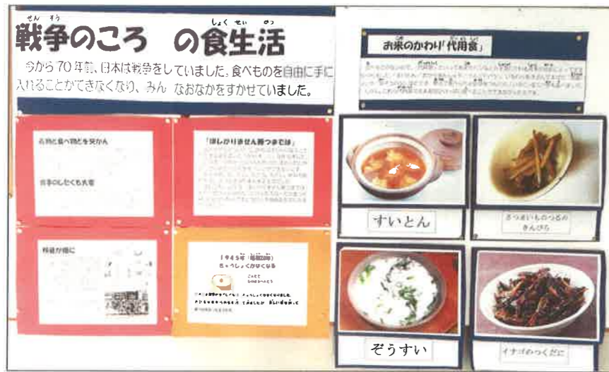
給食室前の、戦争のころの食生活についての掲示

給食をあたり前のように食べられるありがたさ、平和な世の中のすばらしさを、五感を活用しながら学んで欲しいと願っています。