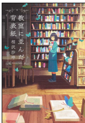
『教室に並んだ背表紙』 相沢沙呼／著 集英社

陰キャと言われた読書家のあおちゃん、他人の読書感想文をパクろうとしているあかね、二次元キャラに恋する萌香…。それぞれが自分の居場所を求めてやってきた図書室で、司書・しおりさんに出会います。すべての問題が一気に解決！とはいかないけれど、人と本とが紡ぎ出す空間・時間の中で、次に踏み出す一歩をみつけます。