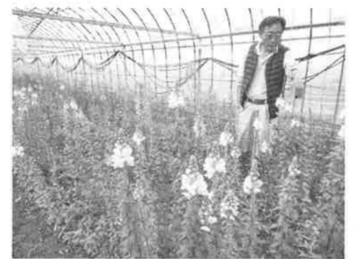
～写真はキンギョソウです～

野菜は収穫のタイミングを少しこえてしまうと、大きくなりすぎて食感が悪くなったりしてしまいます。野菜の成長に合わせてたいていな作業が、おいしくて安全な野菜づくりのポイントになるのです。大切に育てられた野菜を感謝の気持ちをもっていただきましょう。