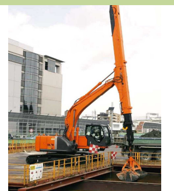
テレスコピックラムシェル