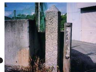
③勝尾寺表参道町石

この地域一帯が藤原氏の氏神、春日神社の社領であった時代（平安時代）にこの地に勧請されたといわれています。境内は愛宕社と徳大寺で祭祀されていた社があります。