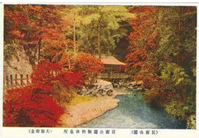
当時の箕面川床の絵はがき（箕面市行政史料）