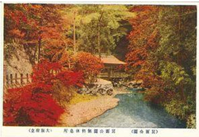
当時の箕面川床の絵はがき（箕面市行政史料）