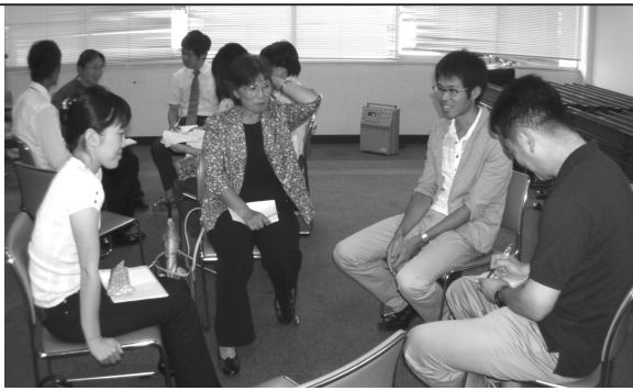
「次世代への継承」分科会

がしている様子 がよくわかりま した。 ただ、もう一 歩進んで、異文 化理解が人権学 習に結びつくこ ころまで行き着 くには、やはり 継続的な取り組 みが必要なので はないでしょう か。後半にお話 しをされた池田 の小学校教諭で