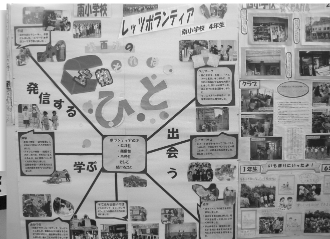
『箕面の宝物 それは ひと』（南小学校発表より） 市制50周年記念「地域探検隊事業」 「わがまち“みのお”大発見」発表会にて（12月1日市民会館大ホール）