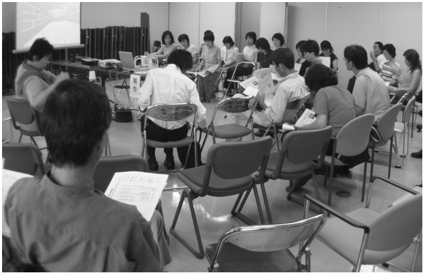
「多文化共生と在日外国人教育」分科会

がしている様子 がよくわかりま した。 ただ、もう一 歩進んで、異文 化理解が人権学 習に結びつくこ ころまで行き着 くには、やはり 継続的な取り組 みが必要なので はないでしょう か。後半にお話 しをされた池田 の小学校教諭で