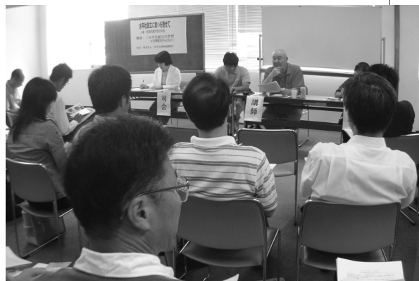
人権・部落問題学習分科会

午後の部では、かつて同推校だった学校で人権 教育を実践されてきた先生、今実践されている先 生の学校教育への思いが話され、会場の全員でパ ネラーの先生方の話を共有できる機会だったと思 います。